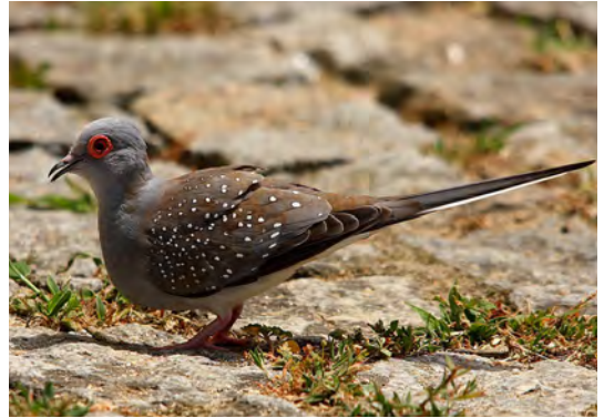
Rolinha-diamante, Serra da Freita, 26.06.2011

Lisboa , Cascais, S. João do Estoril, 13.01. 2011,