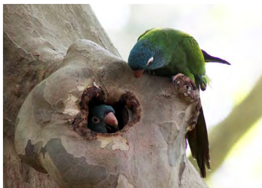
Periquitão-de-cabeça-azul, Jardim Botânico de Lisboa, 16.04.2011.

Lisboa, Lisboa, Benfica, Quinta da Granja, 18.05.2011, 1 ind.