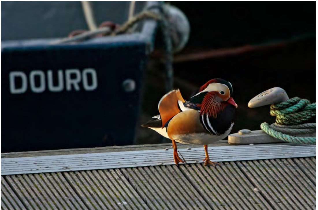
Pato-mandarim, Gaia, 11.01.2011.