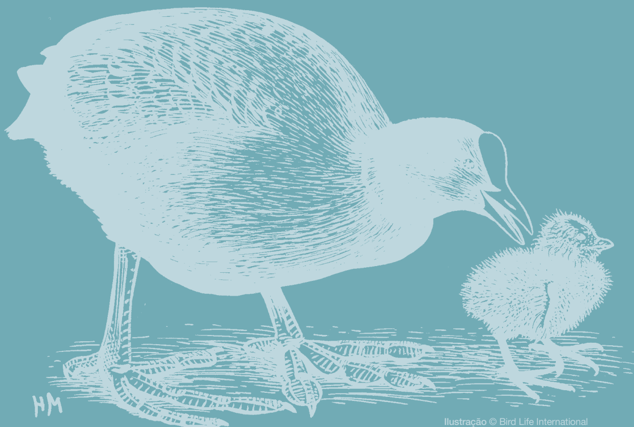
Ilustração © Bird Life International